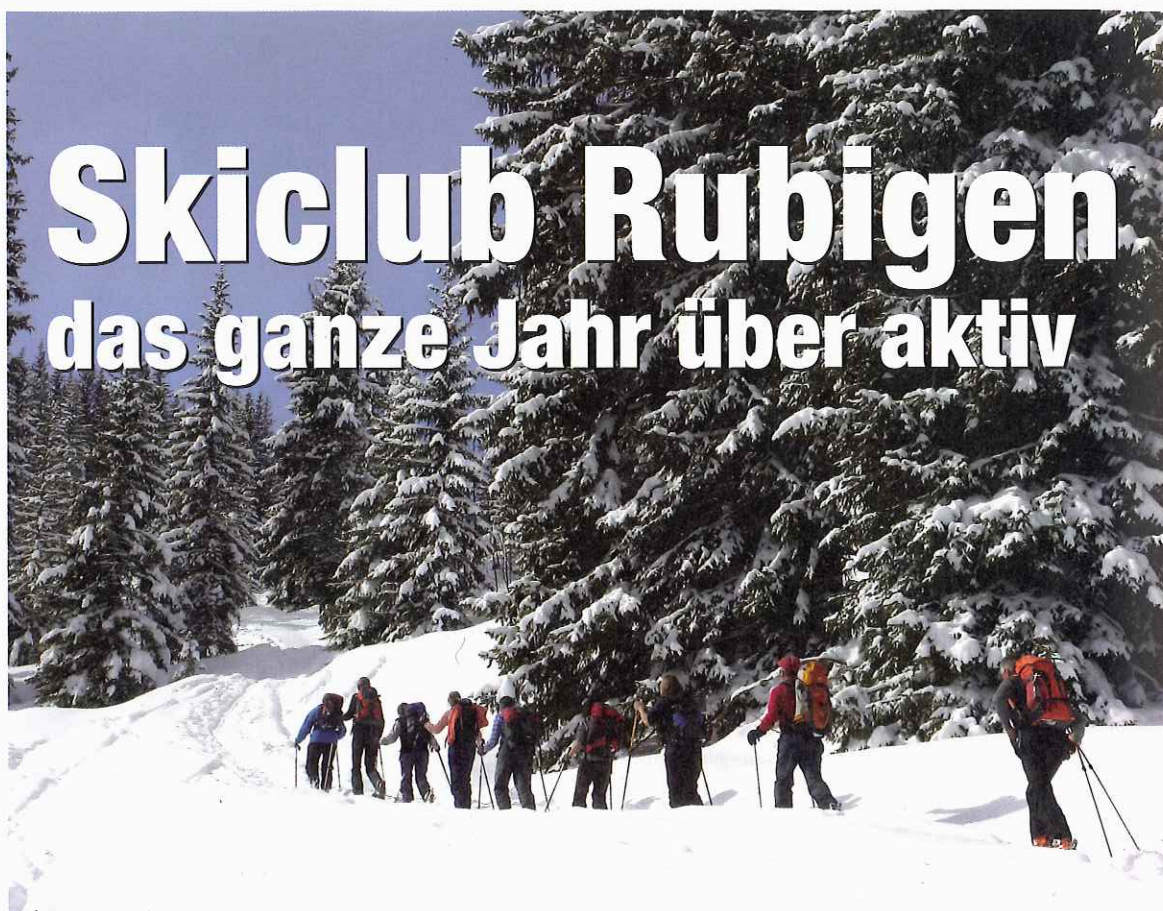
Ob Sommer, ob Winter – beim Skiclub Rubigen ist man oft zusammen unterwegs.

Da es im Klub eine grosse Zahl von Tourenleiterinnen und Tourenleitern gibt, besteht die Möglichkeit, bei grossen Teilnehmerzahlen kleinere Grup-